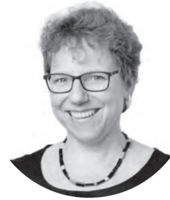
Geschätzte Damen und Herren

Die Einschränkungen des vergangenen Corona-Jahres verlangte uns allen einiges ab. Viele haben dabei die Bewegung im Freien auf neue Art für sich entdeckt, sei es mit regelmässigen Spaziergängen, beim Wandern oder per Velo. Wussten Sie, dass körperliche Ertüchtigung an frischer Luft bei Tageslicht auch die Gesundheit der Augen fördert und positiven Einfluss auf unser Sehverhalten hat? Also nix wie raus, wann immer möglich.